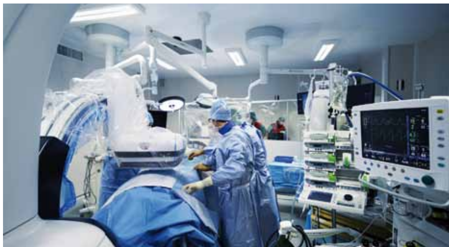
La salle hybride Discovery IGS 730